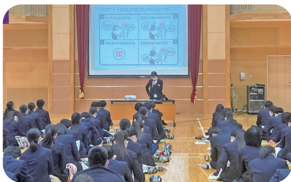
— 2021年12月20日(月) 下関商業高校 —

山口県労福協では、2006年度から今年度までで延べ190校で講座を実施しており、今後も消費経験の少ない若者が正しい消費知識を身に着けるための消費者教育を支援していきます。