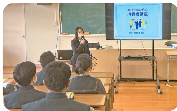
— 2022年2月10日(木) 山口農業高校西市分校 —