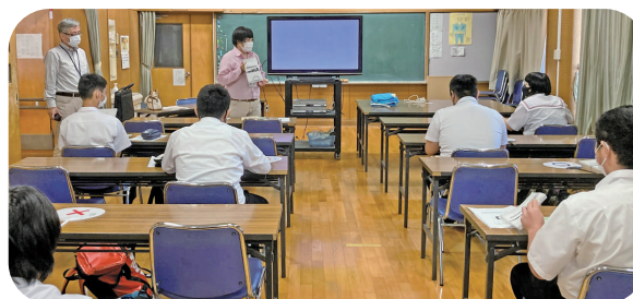
－ 宇部総合支援学校 －

47名が修了しました。受講者は2006年度から今年度までの14年間で431名です。障がい者の就労や自立のため今後も支援を続けます。